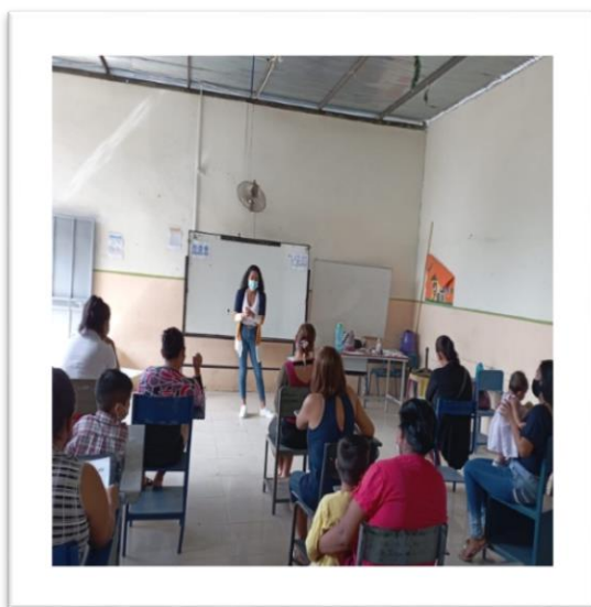
Imagen 1. Bienvenida y presentación de la propuesta dictada a los padres y representantes.

Nombre del proyecto: Con ayuda de mis padres desarrollo mi Lenguaje.