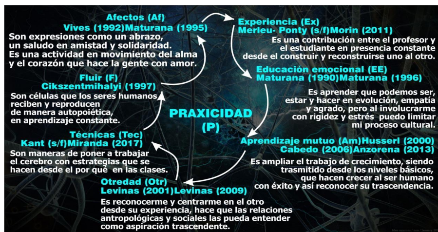
Gráfico 1. Categoría Genérica Praxicidad, con autores y dimensiones hermenéuticas

Con respecto a la categoría genérica Praxicidad, se pudo interpretar que son los distintos aprendizajes mutuos que brindamos desde nuestra experiencia en otredad, son técnicas con educación emocional que logran fluir. Las subcategorías de alumbramiento que la conforman son: Experiencia (Ex), Educación Emocional (EE), Aprendizaje mutuo (Am), Otredad (Otr), Técnicas (Tec), Fluir (F), Afectos (Af).